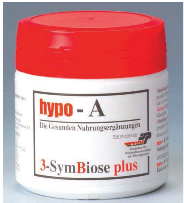
Abb. 2: Präparat 3-SymBiose plus.

Plaque nach Butler et al. (1996); Bleeding on Probing (BOP; Ainamo und Bay 1975); Ermittlung der Sondierungstiefe standardisiert mit WHO-Sonde.